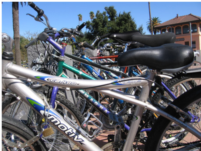
(Bijna iedereen fietst in Davis, wat zeker zal bijdragen aan een gezond gewicht)