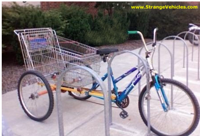
(Een muntjesloze winkelwagen)

Terug naar de verschillen met Nederland: in alle winkels en supermarkten, ook in de goedkoopste zaken zoals de Dollar Tree en de Bargain Market worden je boodschappen voor je ingepakt en in je muntjesloze winkelwagen gezet.